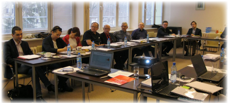
Centrum Partnerstwa Społecznego „Dialog”, Warszawa, 20 - 23.01.2014r. trenerzy związkowi podczas pracy na zorganizowanych warsztatach