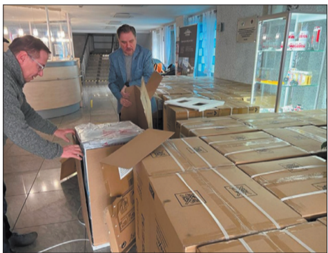
Lodówki, które trafiły do uchodźców z Ukrainy przebywających w ośrodku „Ziemowit” w Jarnołtówku, to dar regionów Śląsko-Dąbrowskiego i Podbeskidzie. (tysol.pl)

Akcja pomocy wciąż trwa. Potrzeba przede wszystkim środków czystości, higieny osobistej i kosmetyków, pampersów, nowej odzieży damskiej i dziecięcej (przede wszystkim bielizny), chemii gospodarczej, zabawek itp. Dary można przekazywać do biur podbeskidzkiej „Sol-