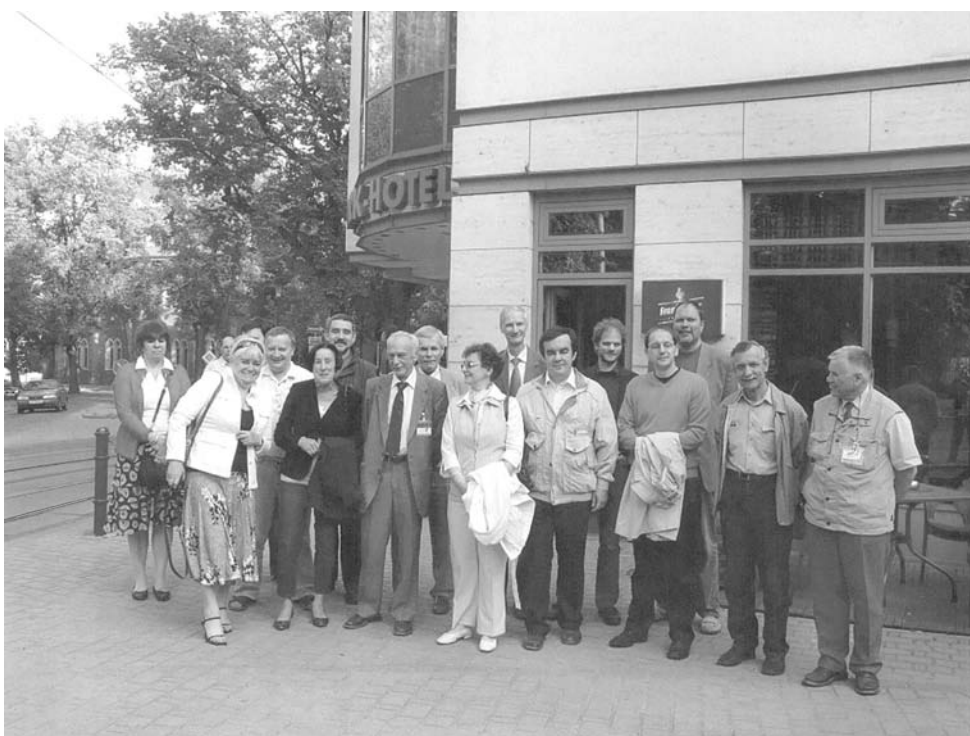
Uczestnicy seminarium

W dniach 20 – 22 czerwca br. odbyło się we Frankfurcie nad Odrą wspólne seminarium niemiecko-polskie zorganizowane przez Gewerkschaft Erziehung und Wissenschaft (GEW) i Krajową Sekcję Nauki NSZZ „Solidarność”. Tematem seminarium był: „ Rozwój szkolnictwa wyższego i badań naukowych. Główne trendy w Polsce i w Niemczech ”. Było to jedno z kolejnych wspólnych seminariów. Poprzednie odbyło się w Kołobrzegu. Wtedy głównym organizatorem była KSN. Tym razem obowiązki gospodarza seminarium przypadły kolegom z GEW. Obrady odbywały się na terenie Uniwersytetu Europejskiego Viadrina. Były tłumaczone na język polski i niemiecki.