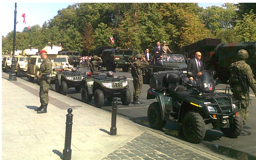
Prezydent Andrzej Duda wizytuje uczestników defilady.