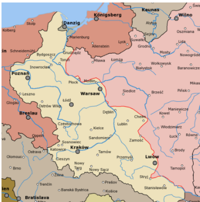
Usytuowanie frontu na początku sierpnia 1920 r.