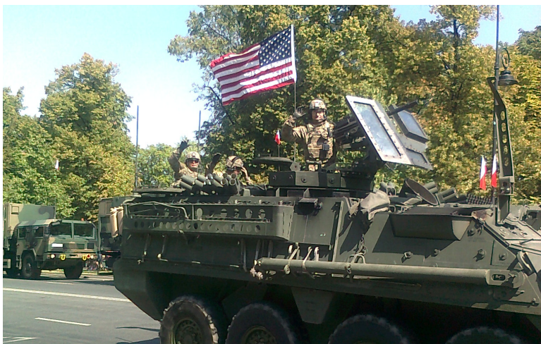
W paradzie wzięli udział także nasi Sojusznicy.