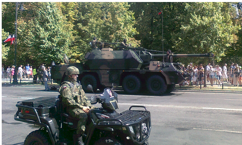
Samobieżna armatohaubica (na drugim planie).