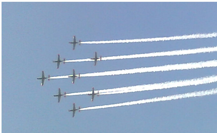
Defiladzie towarzyszyły przeloty samolotów i śmigłowców.

15 sierpnia, w dniu Święta Wojska Polskiego wśród licznych uroczystości i imprez odbyła się w Warszawie defilada wojskowa. (Data 15 sierpnia ta została wybrana dla upamiętnienia zwycięskiej bitwy o Warszawę w sierpniu 1920 r.) Zamieszczamy kilka zdjęć z tej defilady. Red.