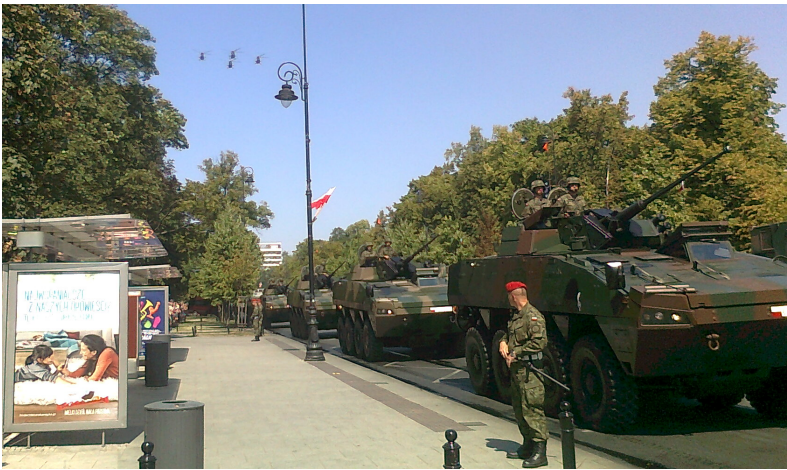
Rosomaki. Kołowe bojowe wozy piechoty z wieżą.