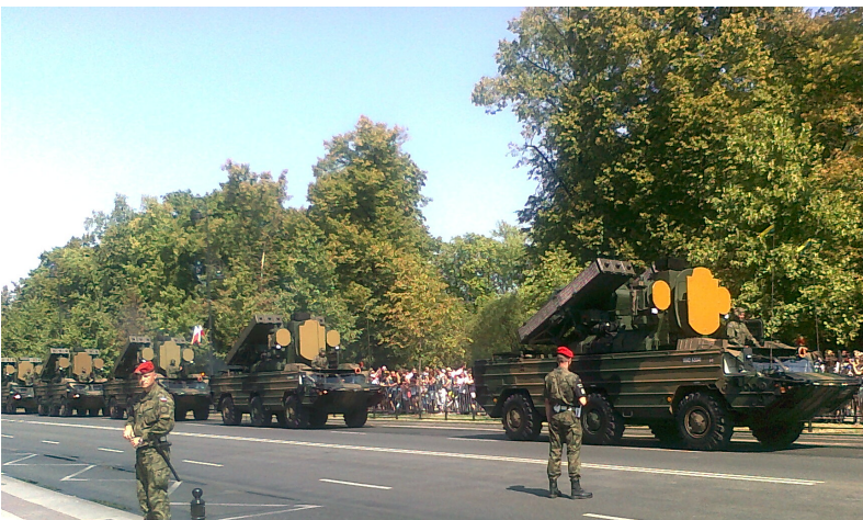
Przeciwlotnicze zestawy rakietowe.