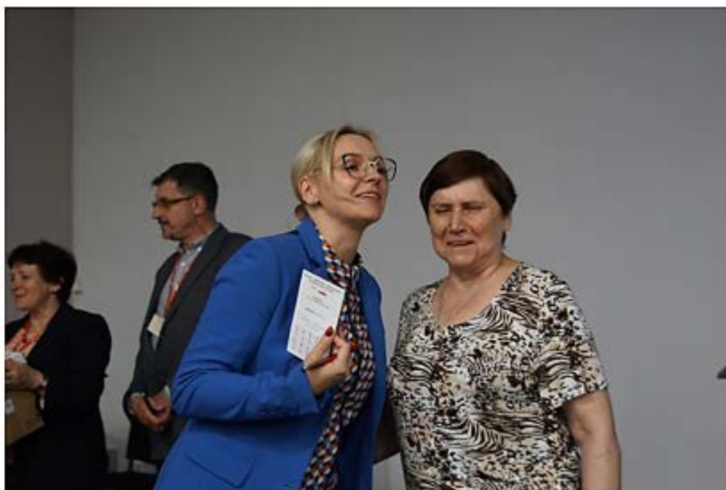
Dziewczyny. No co!