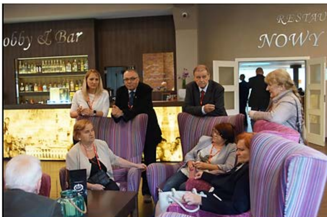
Chwila wytchnienia po trudach debaty