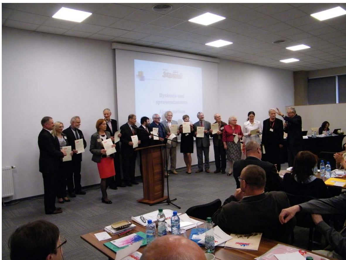
Walne Zebranie Delegatów dziękuje ustępującemu Prezydium Rady KSN