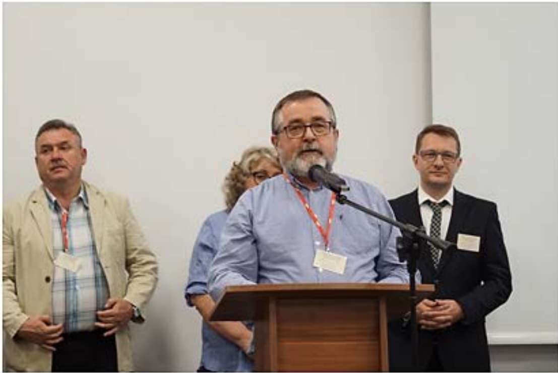
Prezentują się kandydaci do nowej Rady KSN