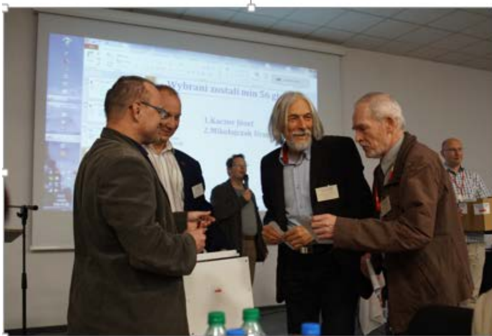
Ważne tematy trzeba omówić w ścisłym gronie