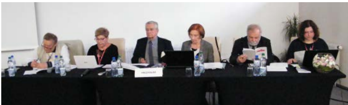
Prezydium WZD w komplecie