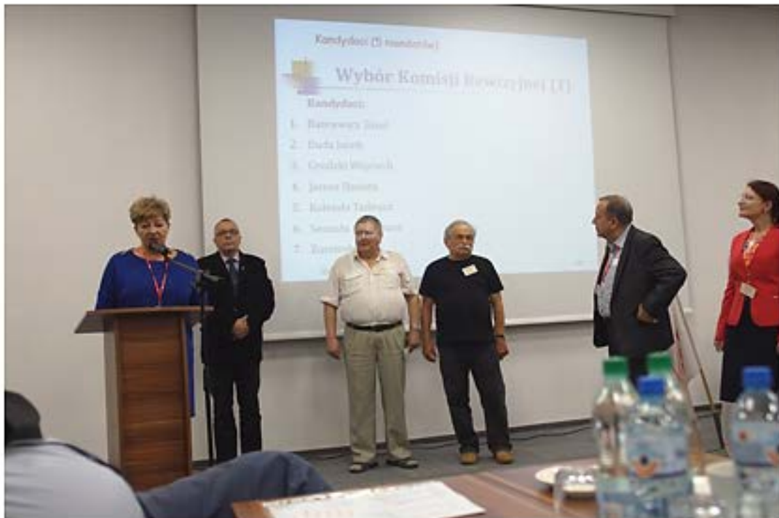
Kandydaci do Komisji Rewizyjnej