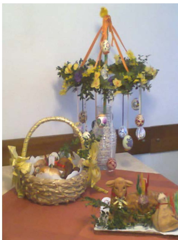
Kompozycja Anny Obrochta