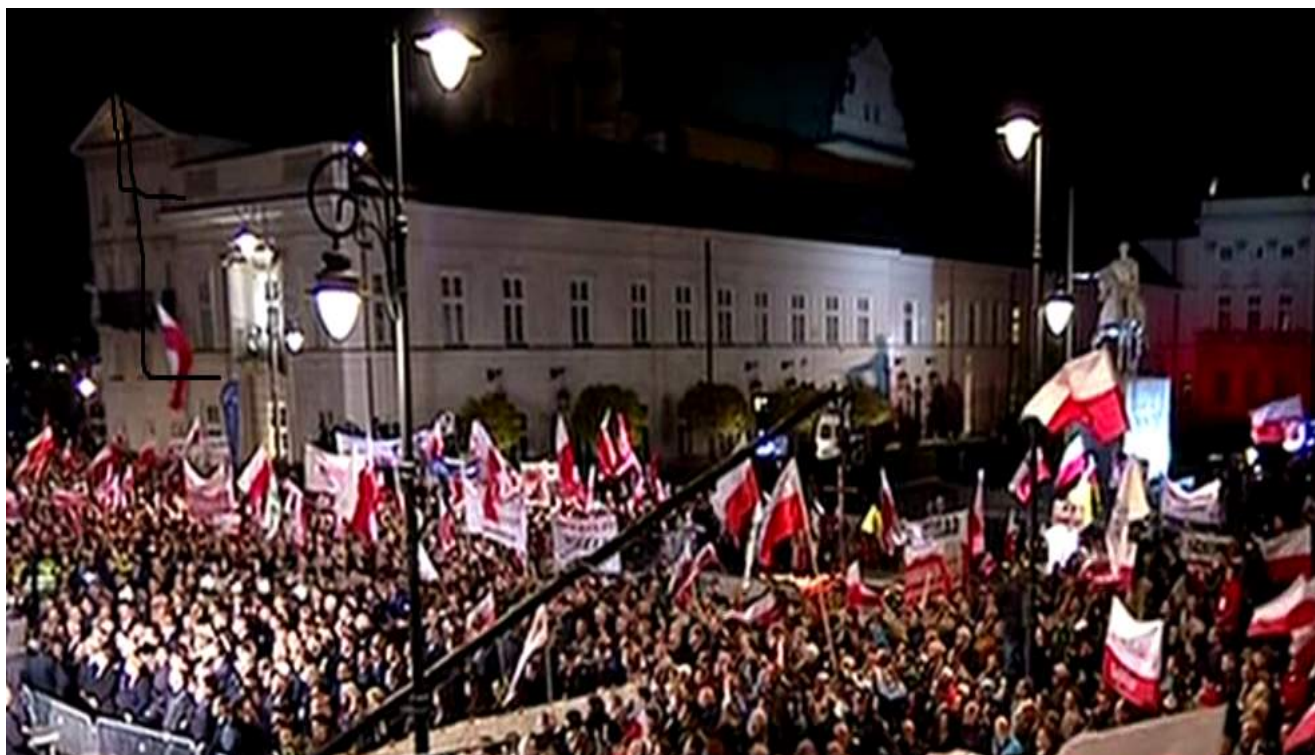
Marsz pamięci przed Pałacem Prezydenckim

W auli Wojskowej Akademii Technicznej na Bemowie odbyło się posiedzenie podkomisji rządowej ponownie badającej katastrofę smoleńską. Wyświetlono film dokumentujący tok badań i osiągniętych ustaleń. Analiza informacji pochodzących z czarnych skrzynek oraz nagrań z wieży lotniska i kabiny pilotów wskazują, że piloci samolotu Tu-154 byli mylnie naprowadzani na pas startowy lotniska. Drugi zakres badań także uwzględniający informacje z czarnych skrzynek wskazuje z zdaniem członków podkomisji na wysokie prawdopodobieństwo stopniowego niszczenia samolotu w wyniku serii wybuchów. Przeprowadzono eksperyment. W makiecie odwzorowującej fragment kadłuba samolotów powodowano detonację różnych rodzajów ładunków wybuchowych. W przypadku materiału wybuchowego nazywanego termobarycznym rozrzut fragmentów makiety i rodzaj odkształceń był bardzo podobny do tego co można było zaobserwować na miejscu katastrofy.