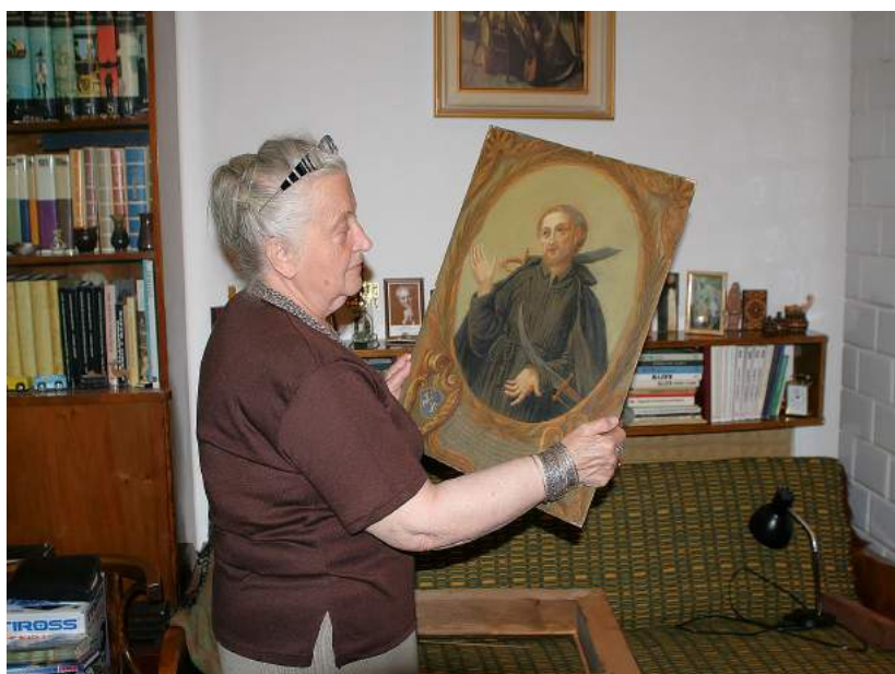
Z odnowionym obrazem św. Andrzeja