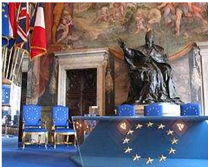
Muzeum Kapitołińskie. Tu podpisano 25 marca 1957 roku pierwszy Traktat Rzymski.

17 marca. W Baden-Baden rozpoczynają się dwudniowe obrady ministrów finansów i szefów banków centralnych najbogatszych gospodarek świata, G20. Po raz pierwszy zaproszono przedstawiciela Polski. Polskę reprezentuje wicepremier Mateusz Morawiecki.