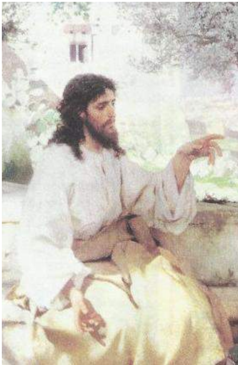
Obraz Henryka Siemiradzkiego „Chrystus w domu Marii i Marty” (fragment)

A On szedł radośnie. Bardzo Ludzki i Wieczny Niósł smaczną rybę – żeby na spotkaniu Radować się wspólną pieśnią i ryby smakowaniem Bo wrócił do nas, do swoich. Wołał – Obudźcie się wreszcie Upieczcie na ogniu rybę. Jestem. Nie gapcie się na mnie Bez myśli bez wspomnienia w strachu niezrozumienia Nie lękajcie się. Cieszcie.