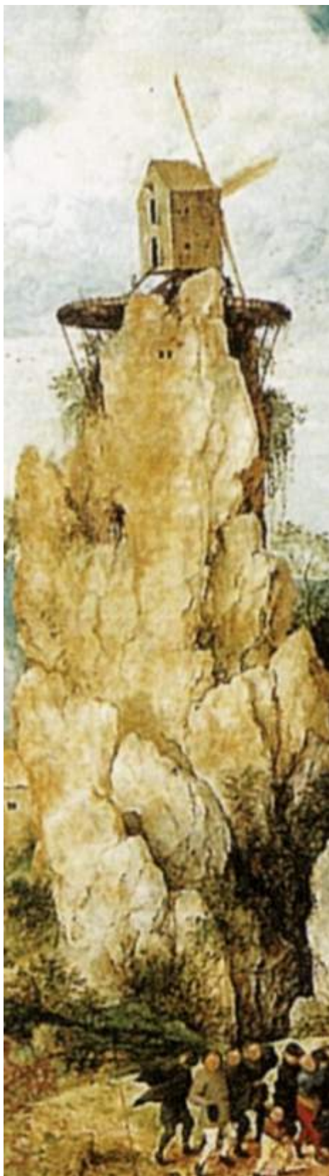
Obraz Petera Brueregela „Młyn i krzyż” (fragment)