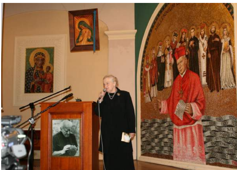
Konferencja Smoleńska. Częstochowa 2010