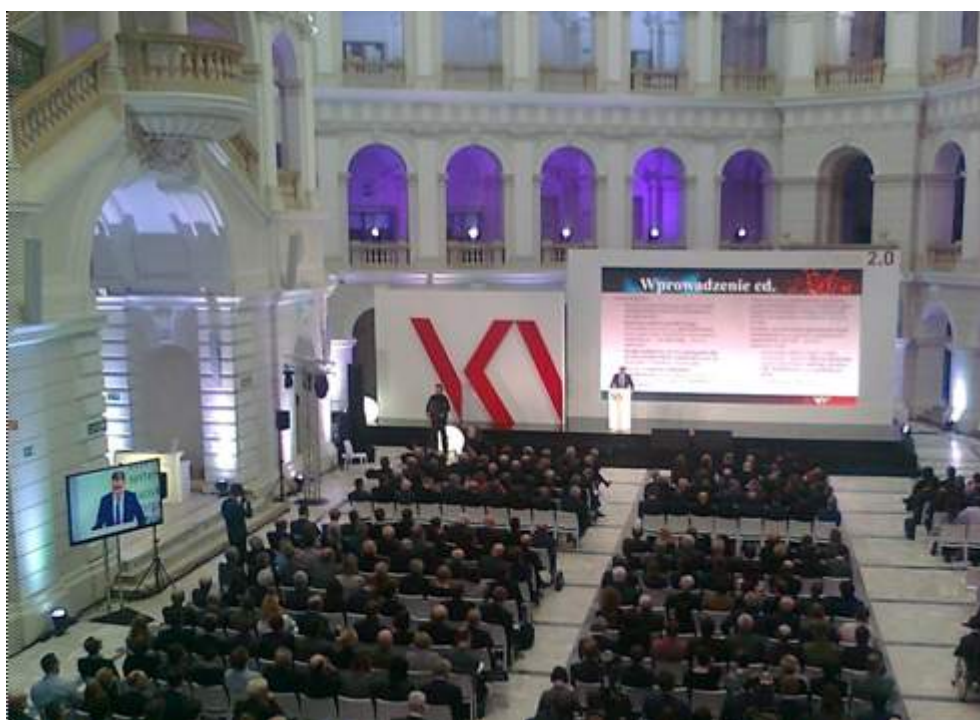
Duża Aula Politechniki Warszawskiej. Prezentacja założeń.