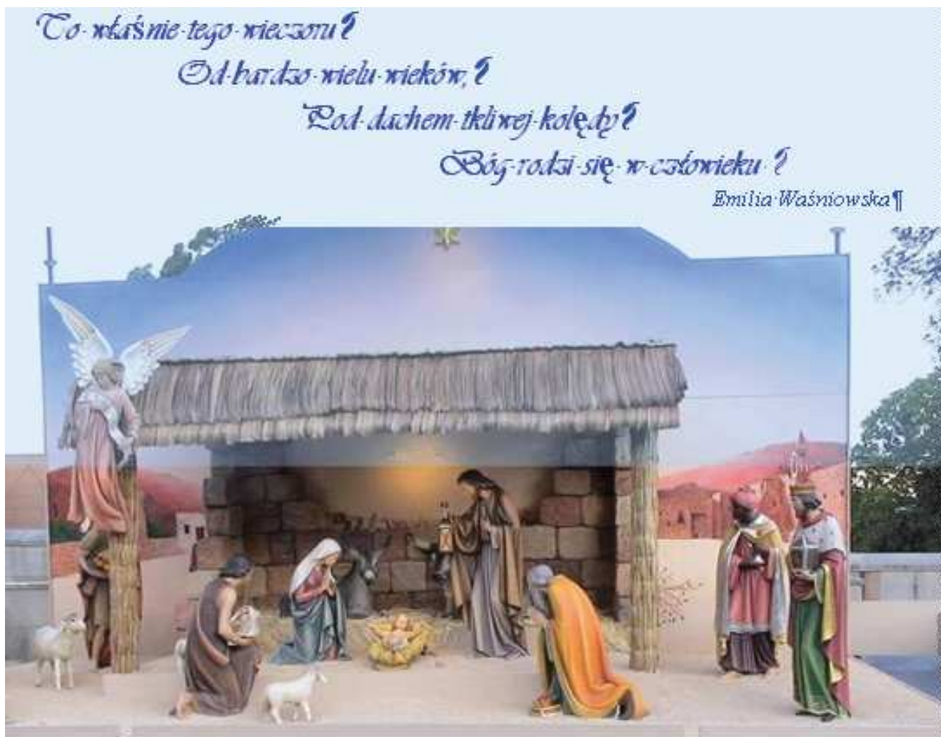
Szopka przed Katedrą Najświętszej Marii Panny w Sydney .