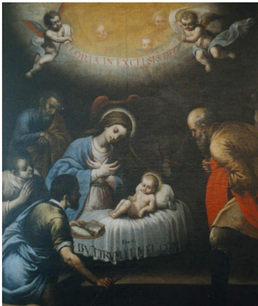
Madonna z dzieciątkiem (malarstwo polskie XVII w., malarz nieznanym).

Ze zbiorów Muzeum Diecezjalnego w Siedlcach.