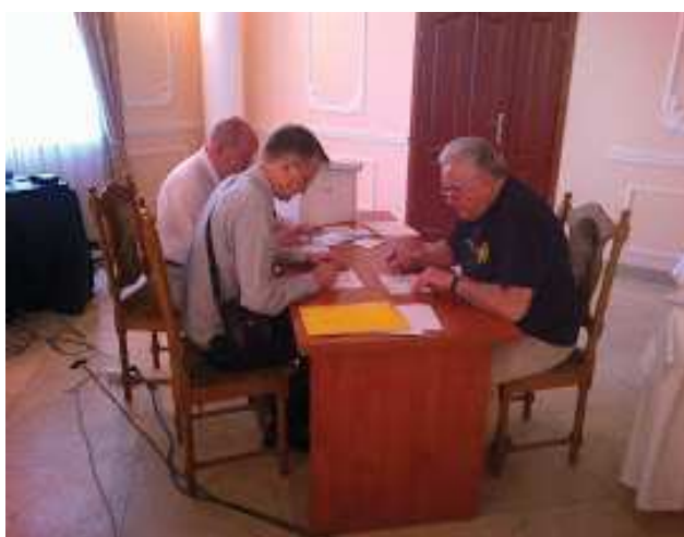
Komisje zjazdowe mają pełne ręce roboty I