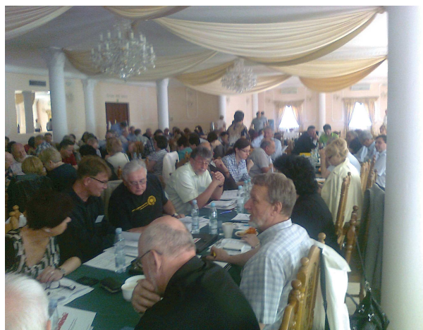
Delegaci podczas obrad II