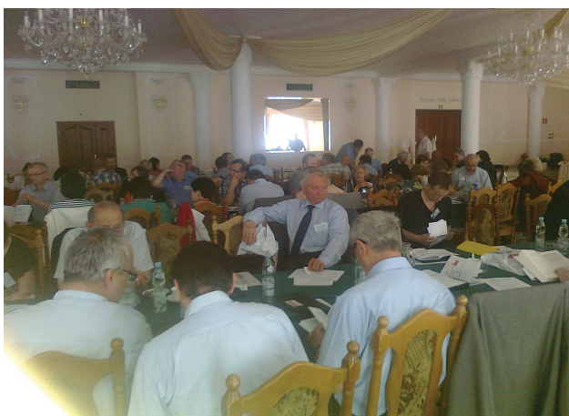
Delegaci podczas obrad III