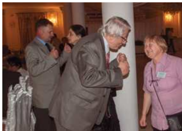
Rozmowy w kuluarach II