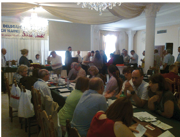
Delegaci podczas obrad I