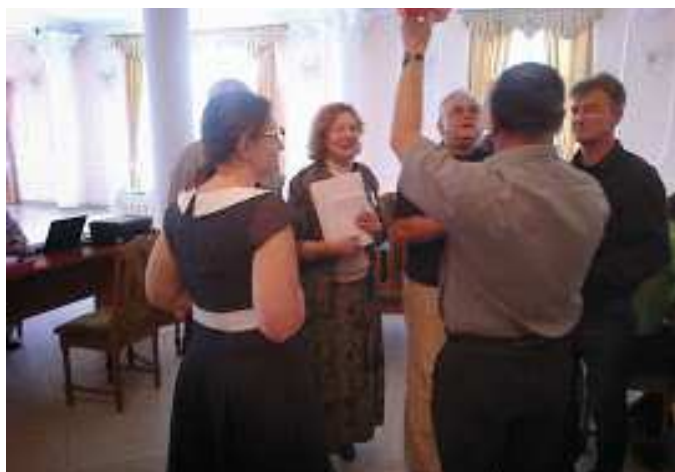
Rozmowy w kuluarach I