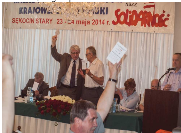
Prezydium WZD II