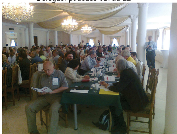
Delegaci podczas obrad IV