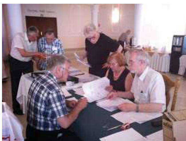
Komisje zjazdowe mają pełne ręce roboty II