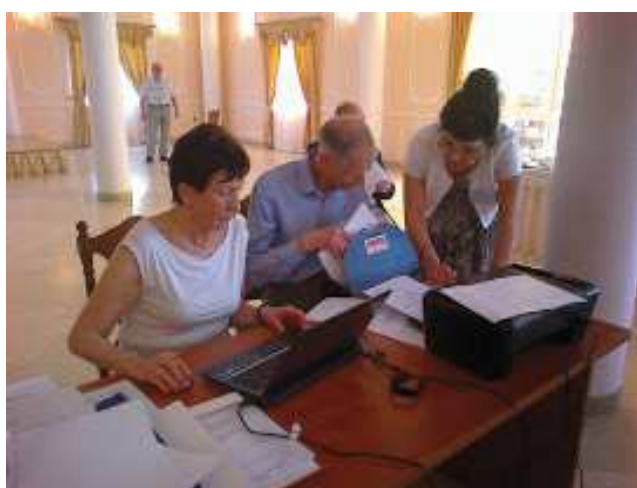
Komisje zjazdowe mają pełne ręce roboty III