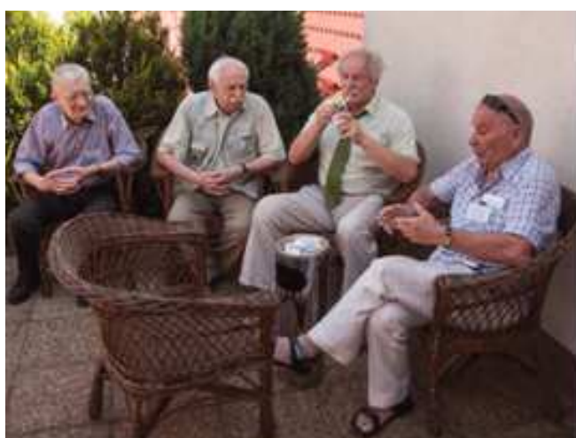
Rozmowy w kuluarach III