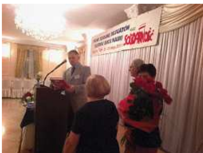
Podziękowania ustępującym władzom i dobre życzenia dla nowo wybranych