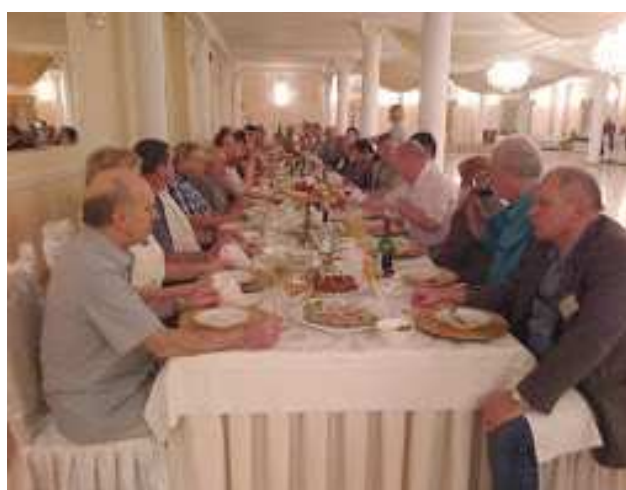
Po obradach - uroczysta kolacja