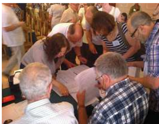
Komisje zjazdowe mają pełne ręce roboty IV