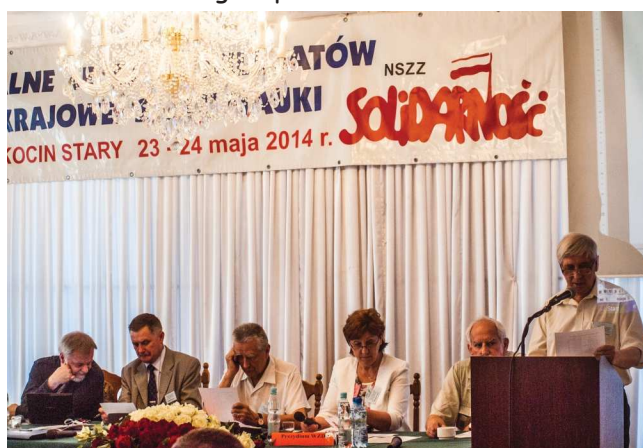
Prezydium WZD I