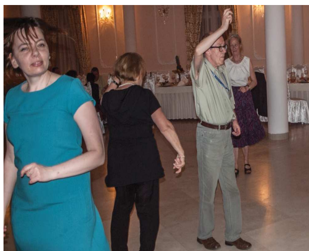
Parkiet był ogromny