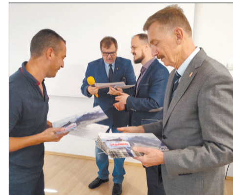
Na zakończenie szkolenia wszyscy jego uczestnicy otrzymali stosowne certyfikaty.

W szkoleniu społecznych inspektorów pracy wzięło udział 47 związkowców z 14 zakładowych organizacji „Solidarności”. Zajęcia prowadzili przedstawiciele PIP z Katowic i oddziału