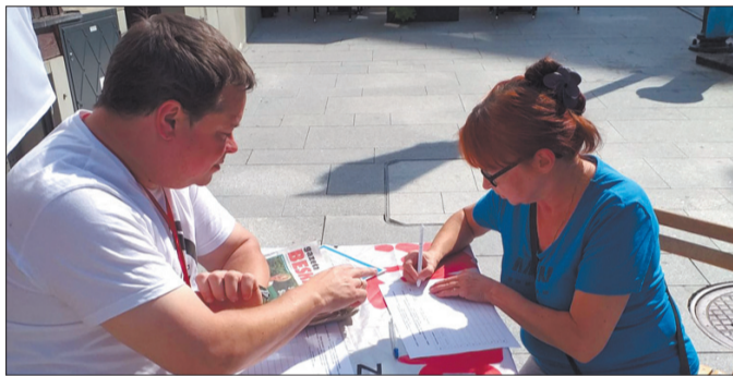
Na Podbeskidziu podpisy popierające projekt ustawy o emeryturach stażowych zbierane były m.in. na ulicach miast.

Podpisy poparcia dla solidarnościowego projektu ustawy o emeryturach stażowych nadal można składać w zakładowych organizacjach związkowych oraz w siedzibie Zarządu Regionu Podbeskidzie NSZZ „Solidarność” i terenowych biurach naszego związku.