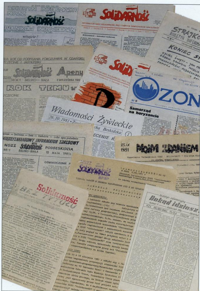
Na Podbeskidziu poza zasięgiem cenzury ukazywały się biuletyny, wydawane przez Komisje Zakładowe, Podregiony, a także przez rolniczą „Solidarność” i Niezależne Zrzeszenie Studentów.