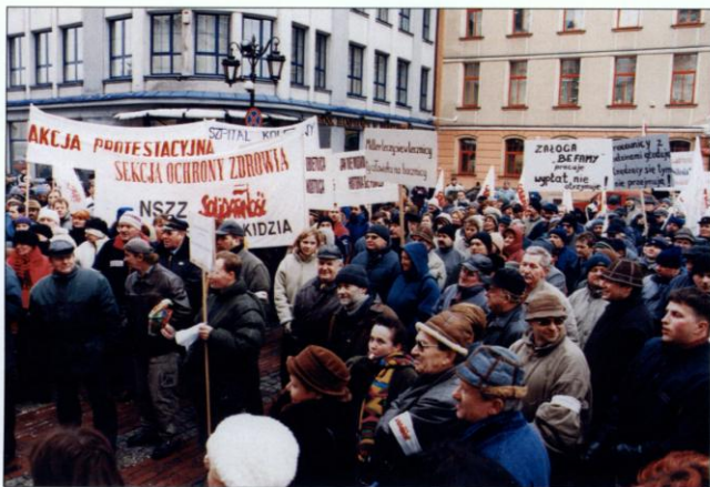
21 lutego 2003 roku - dzień protestu przeciwko antyspołecznej polityce rządu. W ramach tej ogólnopolskiej akcji na placu Ratuszowym w Bielsku-Białej demonstrowało ponad tysiąc związkowców z całego Podbeskidzia.