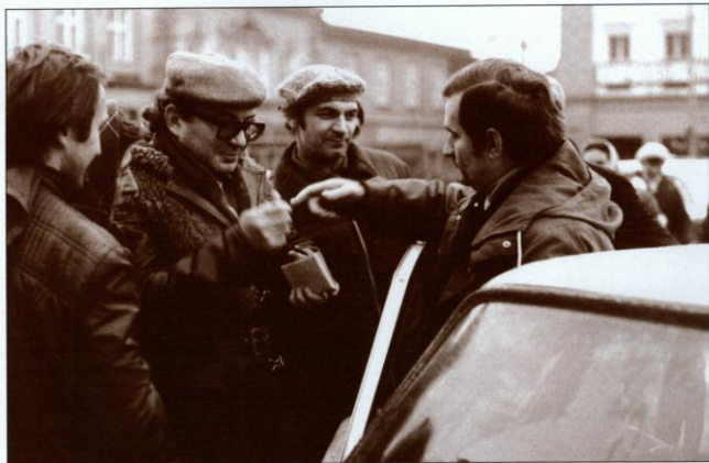
Lech Wałęsa odwiedził 10 listopada 1981 roku Wadowice. Na zdjęciu: przewodniczący Komisji Krajowej z Kazimierzem Podstawą, jednym z działaczy wadowickiej „Solidarność”.