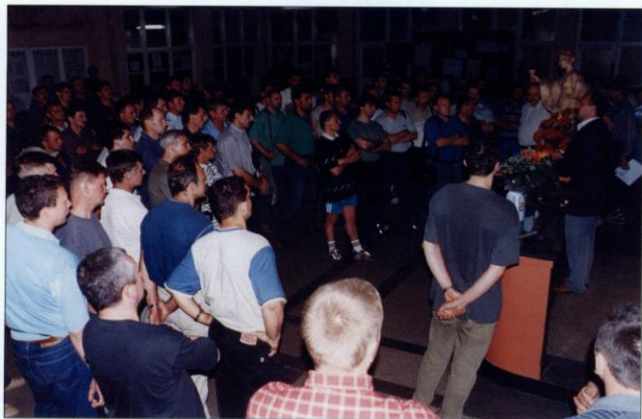
Czechowice-Dziedzice, 26 maja 2003 roku – początek podziemnego strajku „Solidarności” KWK „Silesia” w obronie miejsc pracy i przyszłości swej kopalni.