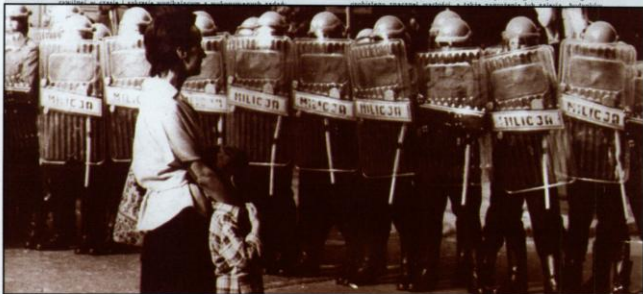
W niedzielę, 13 grudnia 1981 roku zaczął się stan wojenny - czas odwetu komunistów na niepokornych działaczach „Solidarności” i na całym narodzie.

Podaje się również do publicznej wiadomości, że w przypadku obwodzenia lub indywidualnego bezpodstawnego zagrożenia życia, zdrowia lub wolności obywateli albo innych osobistych, indywidualnego lub