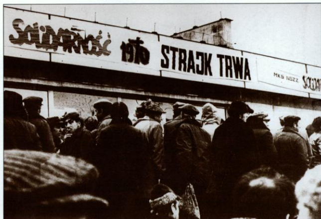
Siedzibą Międzyzakładowego Komitetu Strajkowego NSZZ „Solidarność” Regionu Podbeskidzie była świetlica Zakładów Przemysłu Włókienniczego „Bewelana” w Bielsku-Białej.