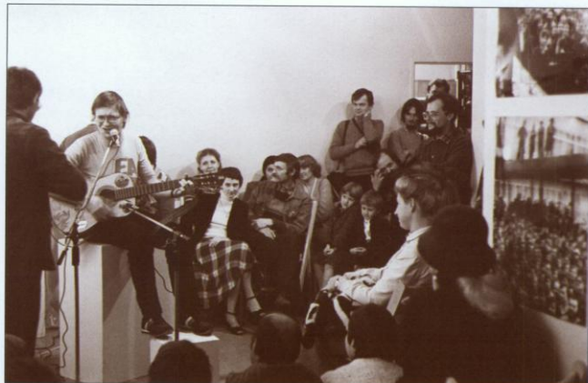
Listopad 1981 roku: koncert Macieja Zembatego w Biurze Wystaw Artystycznych w Bielsku-Białej - w trakcie wystawy fotografii z podbeskidzkiego strajku.