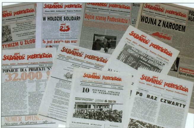
Pod koniec 2005 roku minęło czterdzieści lat istnienia „Solidarności Podbeskidzia”. 15 grudnia ukazał się 331 numer tego pisma. Teraz jest to comiesięczna wkładka w „Kronice Beskidzkiej”.