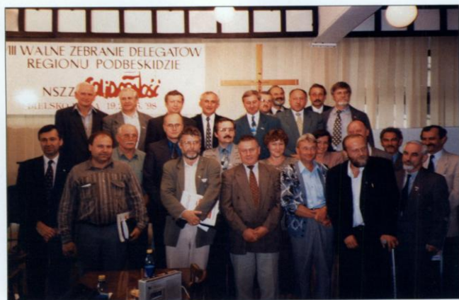
Członkowie Zarządu Regionu Podbeskidzie NSZZ „Solidarność” kadencji 1998-2002, wybrani 20 czerwca 1998 roku podczas wyborczego zjazdu podbeskidzkiej „Solidarności”.