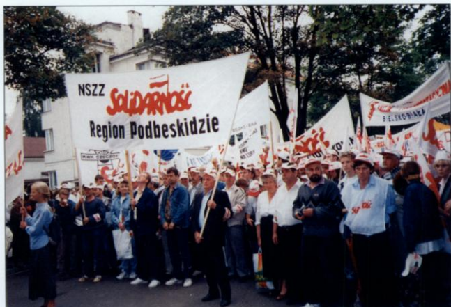
Warszawa, 31 sierpnia 1996 roku – reprezentacja Podbeskidzia była widoczna w tłumie demonstrantów z całej Polski, manifestujących w stolicy w XVI rocznicę Sierpnia.