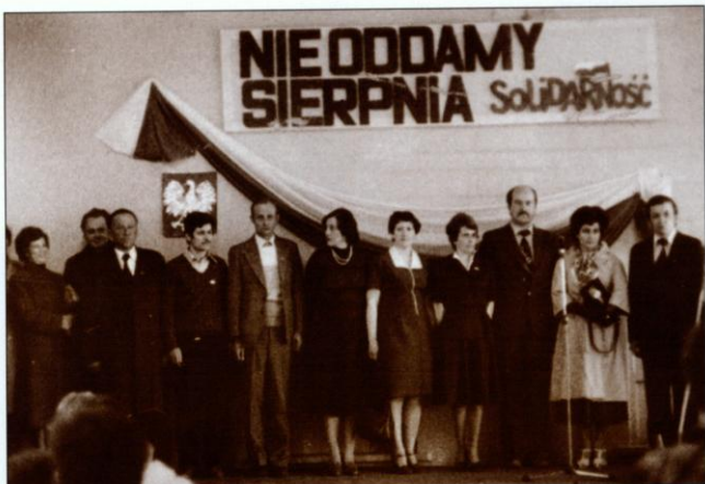
Uroczystość poświęcenia sztandaru „Solidarność” Węzła PKP w Suchej Beskidzkiej odbyła się 25 kwietnia 1981 roku. Był to pierwszy sztandar „Solidarność” na terenie Południowej DOKP.