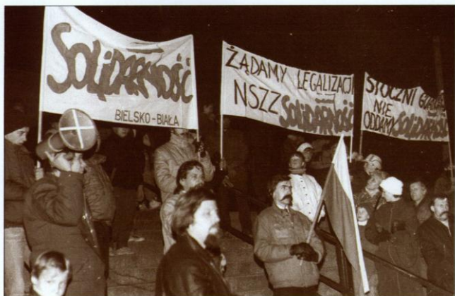
W dniu nieznanego przez komunistów Święta Niepodległości, 11 listopada 1988 roku, odbyła się przed kościołem w Bielsku-Białej Aleksandrowicach manifestacja zwolenników zdelegalizowanej „Solidarności”.