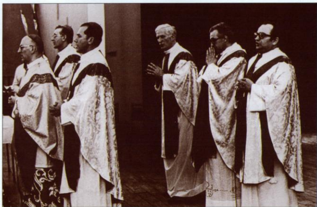
Wielką rolę w pokojowym rozwiązaniu podbeskidzkiego konfliktu mieli przedstawiciele Kościoła. Po podpisaniu porozumienia na sali „Bewelany” została odprawiona Msza św., której przewodniczył biskup Bronisław Dąbrowski, osobisty wysłannik Prymasa Stefana Wyszyńskiego.