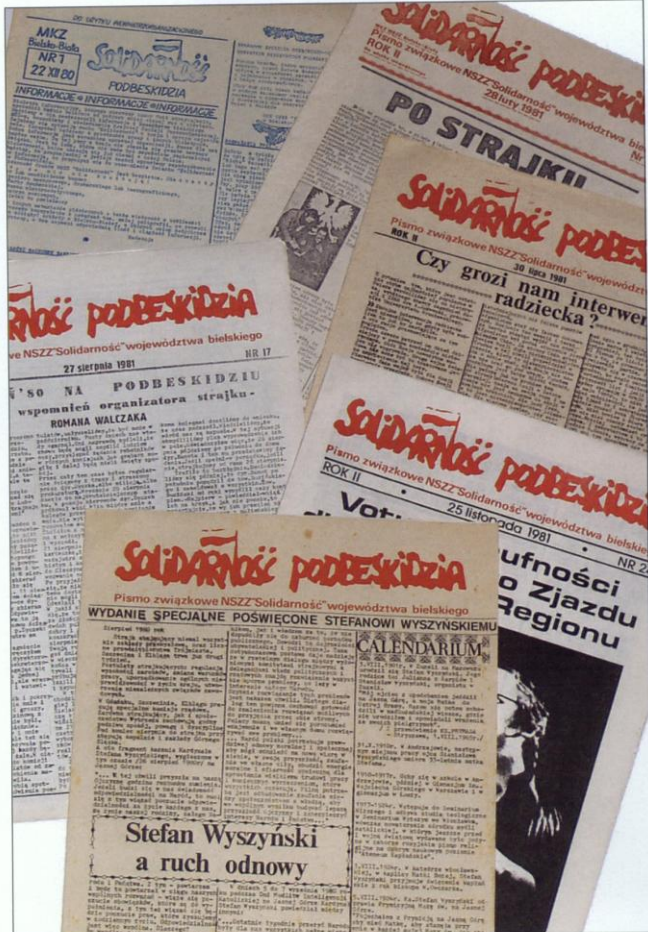
Pierwsze numery „Solidarności Podbeskidzia”. Główny regionalny biuletyn związku zaczął się ukazywać 22 grudnia 1980 roku. Do stanu wojennego ukazały się 24 numery tego pisma.