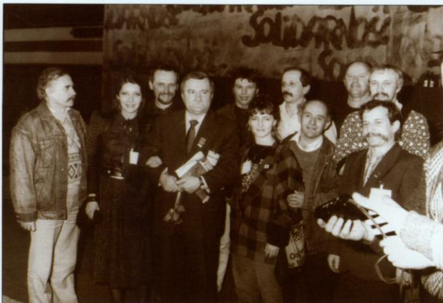
Związkowcy z Podbeskidzia wraz z Lechem Wałęsą podczas II Krajowego Zjazdu Delegatów NSZZ „Solidarność” w Gdańsku.