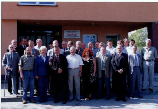
Członkowie Zarządu Regionu Podbeskidzie kadencji 2002-2006 przed nową siedzibą podbeskidzkiej „Solidarności” przy ul. Adama Asnyka 19.