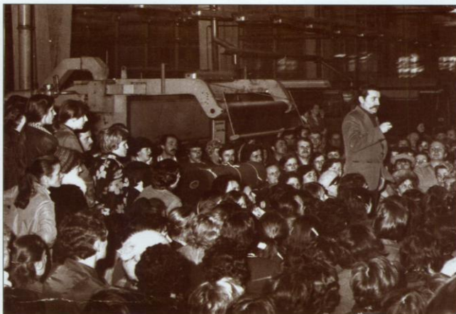
Lech Wałęsa przyjechał do Bielska-Białej, by zgasić podbeskidzki strajk. Zmienił zdanie po poznananiu listy zarzutów i rozmowach ze zdesperowanymi załogami strajkujących zakładów.