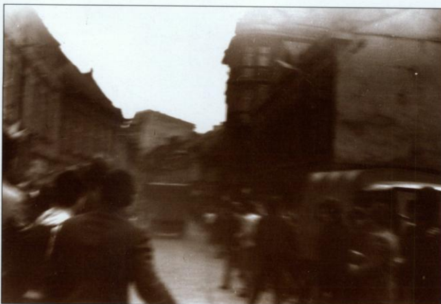
Jedno z nielicznych zdjęć z bielskich manifestacji w stanie wojennym – 1 maja 1982 roku milicyjna ciężarówka przejeżdża przez środek milczącej demonstracji zwolenników „Solidarności” na ówczesnej ul. Dzierżyńskiego (dzisiejszej ul. 11 listopada).