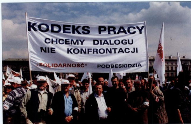
W proteście przeciwko zmianom w prawie pracy ponad tysiąc związkowców z Podbeskidzia uczestniczyło 26 kwietnia 2002 roku w warszawskiej manifestacji „Solidarności”.