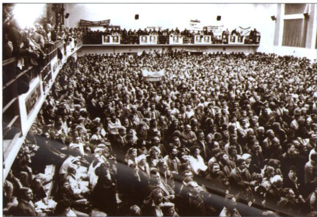
Jesień 1995 roku - bielski wiec wyborczy Lecha Wałęsy. Na Podbeskidziu – w przeciwieństwie do reszty kraju – wygrał on te wybory prezydenckie.