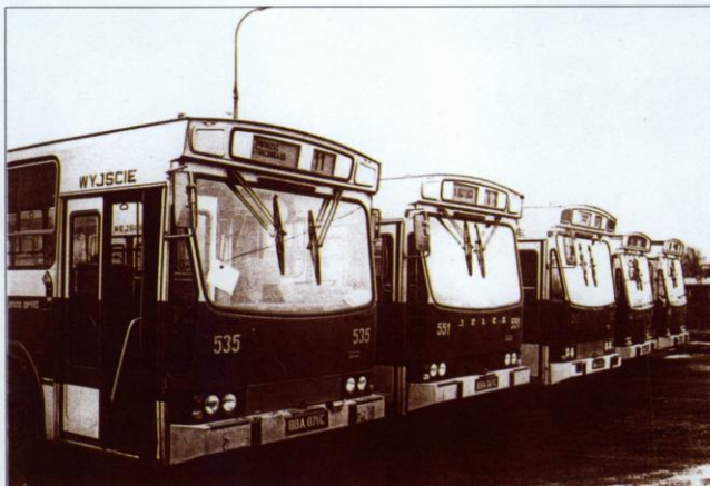
Strajk kierowców autobusów Wojewódzkiego Przedsiębiorstwa Komunikacyjnego w Bielsku-Białej był najbardziej czytelnym sygnałem, że Podbeskidzie także solidaryzuje się ze strajkującymi robotnikami Wybrzeża.