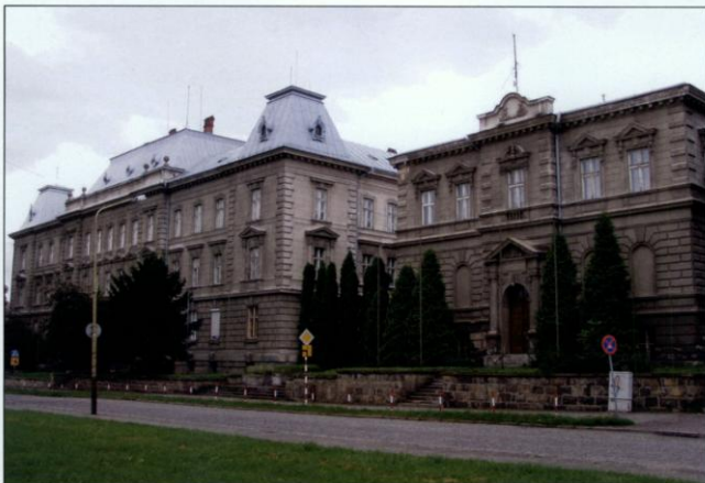
W tym budynku od 1975 roku mieścił się Komitet Wojewódzki Polskiej Zjednoczonej Partii Robotniczej. Podbeskidzki strajk wymierzony był – między innymi – przeciwko decydom, urzędującym w tym gmachu.