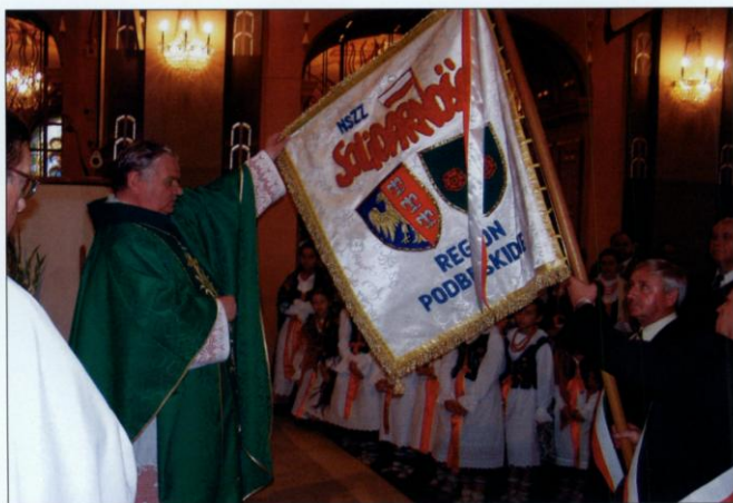
W ramach obchodów 25-lecia „Solidarności” biskup Tadeusz Rakoczy poświęcił 28 sierpnia 2005 roku w bielskiej katedrze pw. św. Mikołaja nowy sztandar podbeskidzkiej „Solidarności”.