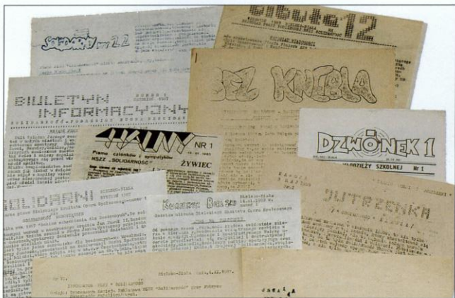
Niektóre z pism podziemnych, jakie w latach 1982-89 ukazywały się na terenie Podbeskidzia.