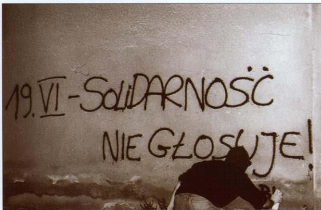
Bielsko-Biała, czerwiec 1988 roku: podziemny malarz przypomina o ogłoszonym przez „Solidarność” bojkocie pseudowyborów do rad narodowych.