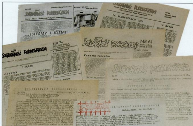
W marcu 1982 roku zostało wznowione wydawanie „Solidarności Podbeskidzia”. Zmieniły się metody druku i wygląd kolejnych numerów tego biuletynu, sygnowanego przez Regionalną Komisję Wykonawczą „Trzeci Szereg” NSZZ „Solidarność” Regionu Podbeskidzie.