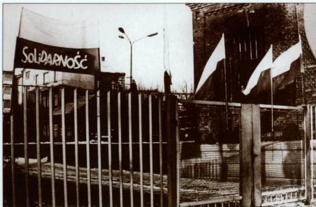
Podbeskidzki strajk generalny – przez 10 dni na zamkniętych bramach setek zakładów pracy wisiały transparenty i narodowe flagi.