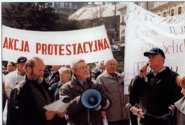
Bielski plac Chrobrego, 3 kwietnia 2002 roku – wiec podbeskidzkiej „Solidarności” w obronie kodeksu pracy.