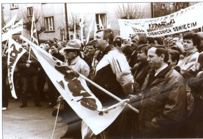
24 kwietnia 1992 roku przed Urzędem Wojewódzkim w Bielsku-Białej ponad pół tysiąca związkowców z całego Podbeskidzia protestowało przeciwko błędom w społeczno-gospodarczej polityce rządu.