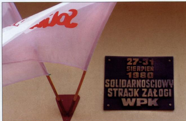
W pierwszą rocznicę strajku na budynku zajezdni autobusowej WPK odsłonięta została tablica, upamiętniająca solidarnościowy protest kierowców.