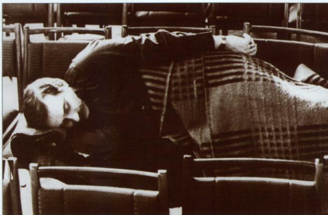
Przewodniczący Krajowej Komisji Porozumiewawczej pozostał w świetlicy „Bewelany” do końca strajku. Był z nimi na dobre i na złe, w dzień i w nocy.