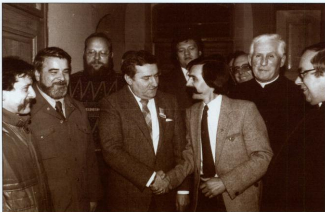
Tego samego dnia przewodniczący zdelegalizowanej „Solidarności” wziął udział w uroczystej Mszy św. odprawionej w kościele pw. św. Mikołaja. Na zdjęciu: Wałęsa na probostwie w otoczeniu kapłanów i działaczy podbeskidzkiej „Solidarności”.