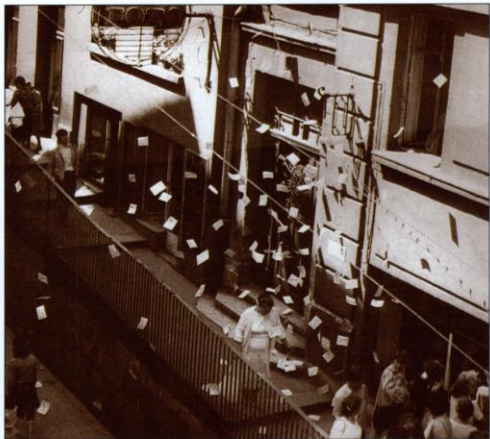
Pasaż w centrum Bielsku-Białej: jedna z akcji ulotkowych, organizowanych i przeprowadzanych przez młodzieżowe grupy Bielskiego Komitetu Oporu Społecznego.