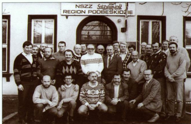
Pamiątkowe zdjęcie członków Zarządu Regionu Podbeskidzie (kadencji 1989-1992), wykonane 24 lutego 1992 roku przed siedzibą ZR przy ul. Partyzantów 59.