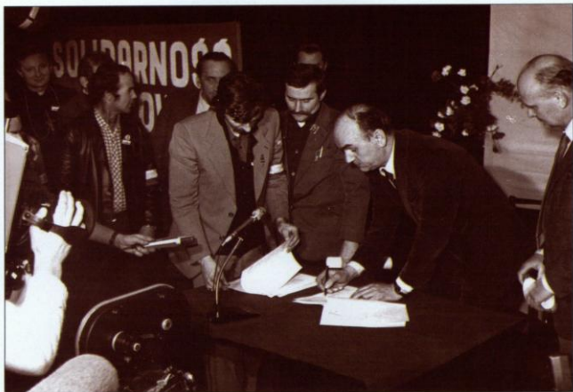
W końcu doszło do zawarcia porozumienia między strajkującymi i delegacją rządową. Dokument, kończący podbeskidzki strajk generalny, został podpisany nad ranem 6 lutego 1981 roku.