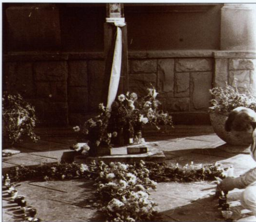
Kwiatny krzyż przy kościele pw. Opatrzności Bożej w Białej, układany przez sympatyków „Solidarności” od 1982 roku. Ten, widoczny na zdjęciu, powstał jesienią 1984 roku - po zamordowaniu ks. Jerzego Popiełuszki.